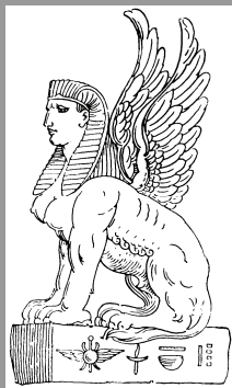
Le Sphynx d'Égypte.

Les instructeurs de l'A.G.I.R.A. qui donnent les conférences publiques et les cours réguliers comptent plusieurs années d'étude et d'expérience dans cet enseignement.