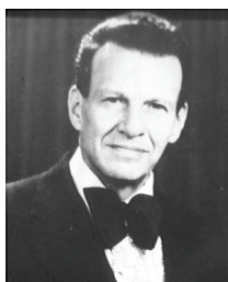
Samaël Aun Weor 1917-1977 Fondateur de L'A.G.I.R.A.

L'A.G.I.R.A., c'est l'Association Gnostique Internationale de Recherches Anthropologiques. Il s'agit d'un organisme à but non lucratif qui diffuse l'enseignement de l'anthropologue et humaniste Samaël Aun Weor. C'est donc une école, ouverte à tous sans distinction de croyances ou de classes sociales. Cette association qui a son origine au Mexique, est présente un peu partout dans le monde et les gens qui en font parti s'intéressent particulièrement à la philosophie, l'art, la science et la mystique. L'être humain est le point central de nos recherches, lesquelles se basent sur les grandes civilisations du passé: Égyptiennes, Aztèques, Mayas, Indes, etc.. L'humanité actuelle, avec tous ses progrès technologiques, n'a pas encore atteint le degré d'éveil spirituel de ces cultures anciennes. Malgré des formes de manifestations différentes, la connaissance de ces civilisations conver-